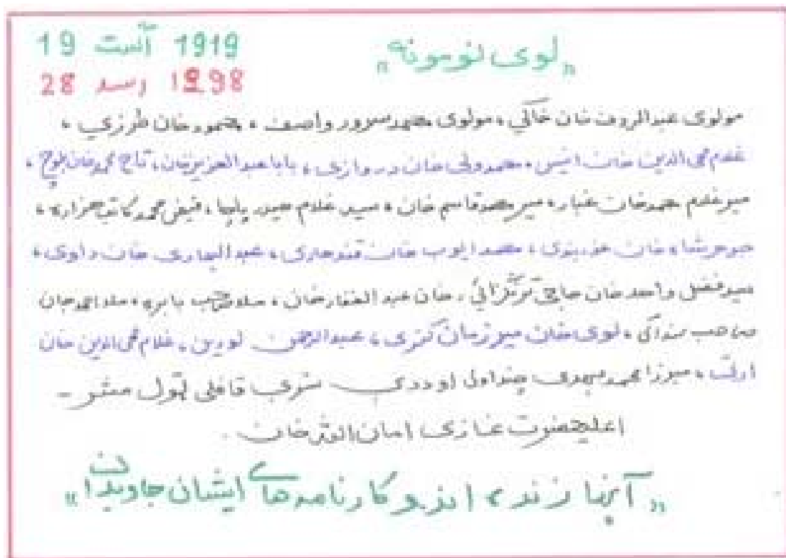
نامه‌های بزرگان و جاویدان مشروطیت اول و دوم